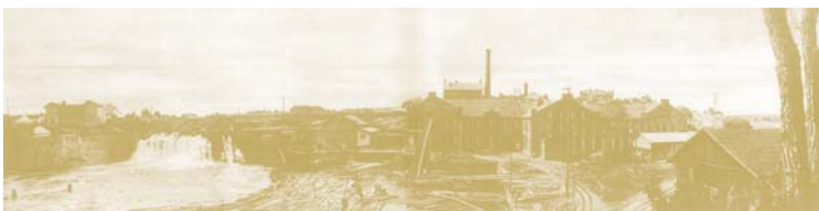
Puulhiomo ja kartonkitehdas Korkeakoskella