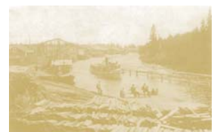
Karhulan sahan lautatarha 1890