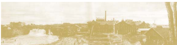
Puuhiomo ja kartonkitehdas Korkeakoskella